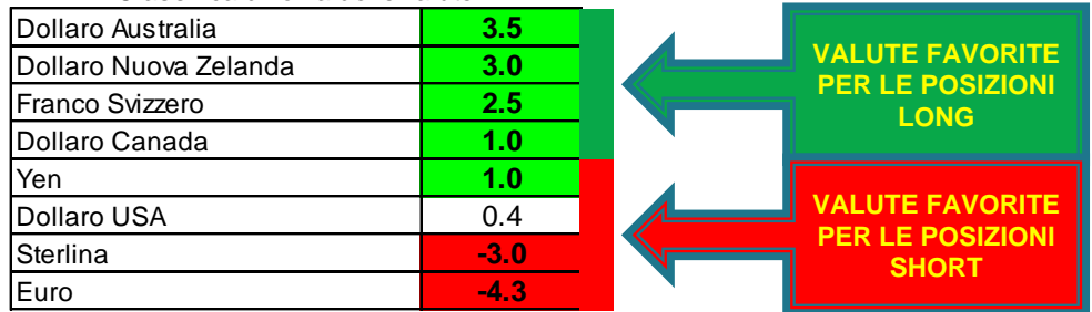
Classifica di forza delle valute

La valutazione operativa che emerge dal quadro algoritmico, dalla classifica di forza e dalle letture di RRR (Reward/Risk Rating) dei vari cambi e cross rates indica, come tre trades di posizione favoriti per il periodo in esame (15.01 → 28.02):